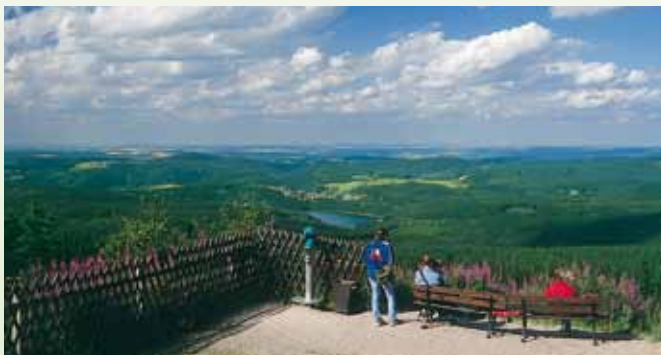
Panoramaaussicht vom Auersberg zur Talsperre Sosa

die Schönheiten des Erzgebirges mit seinen dunklen Wäldern, romantischen Tälern und Bergeshöhen sowie seinen freundlichen und fleißigen Bewohnern, allen Menschen in Deutschland nahe zu bringen. Fortan wurden Tausende Kilometer Wanderwege erschlossen, gebaut, beschildert und in ersten Wanderkarten wiedergegeben. Aussichtstürme, Rastplätze und Berggasthöfe entstanden. Zahlreiche Gäste, zuerst aus den alten Industrieregionen Sachsens, später aus ganz Deutschland, suchten und fanden hier ausgiebige Erholung und Entspannung.