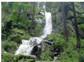
Sachsens größter Wasserfall bei Blauenthal

Die Region rund um den Auersberg (1.018 m) zählt zu den schönsten und ältesten Wanderregionen Deutschlands. Nicht von ungefähr entstand gerade hier im Jahre 1878 die Idee, mit der Gründung eines Erzgebirgsvereines