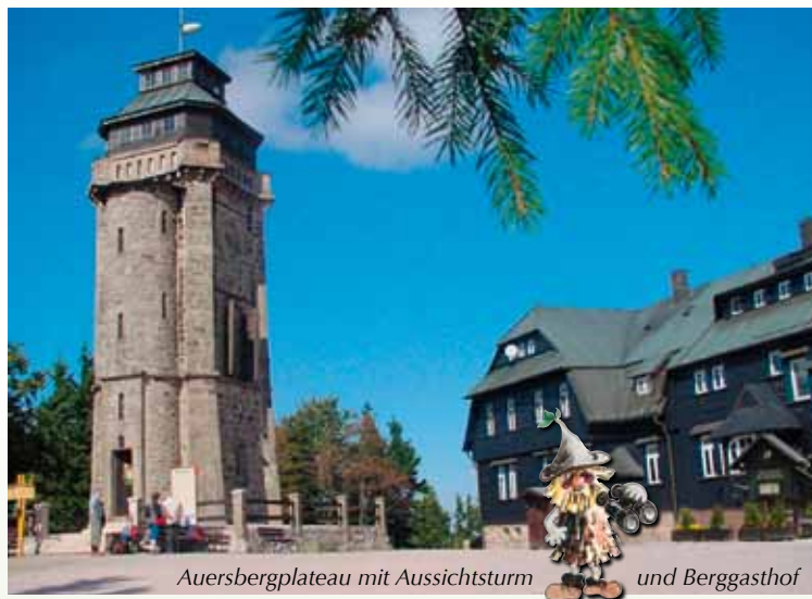
Auersbergplateau mit Aussichtsturm und Berggasthof

(aus einem alten Wanderführer der Region)