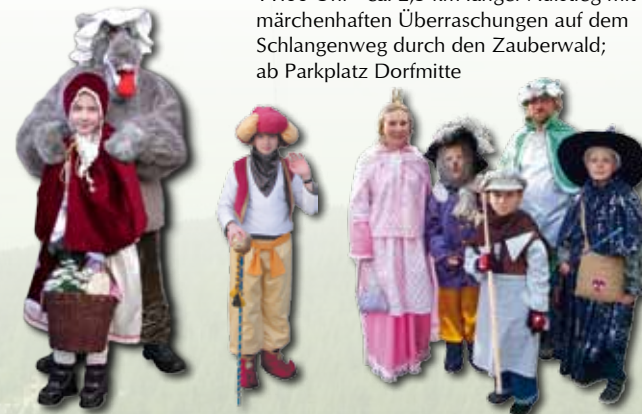
Musikalische Begrüßung durch die Bergkapelle Johanngeorgenstadt